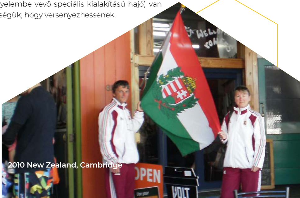
2010 New Zealand, Cambridge

A mozgásukban korlátozott sportolóknak adaptív hajóra* (*a versenyző egészségügyi problémáit figyelembe vevő speciális kialakítású hajó) van szükségük, hogy versenyezhesenek.